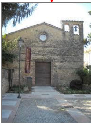
Sala Polifunzionale SAN MARCO